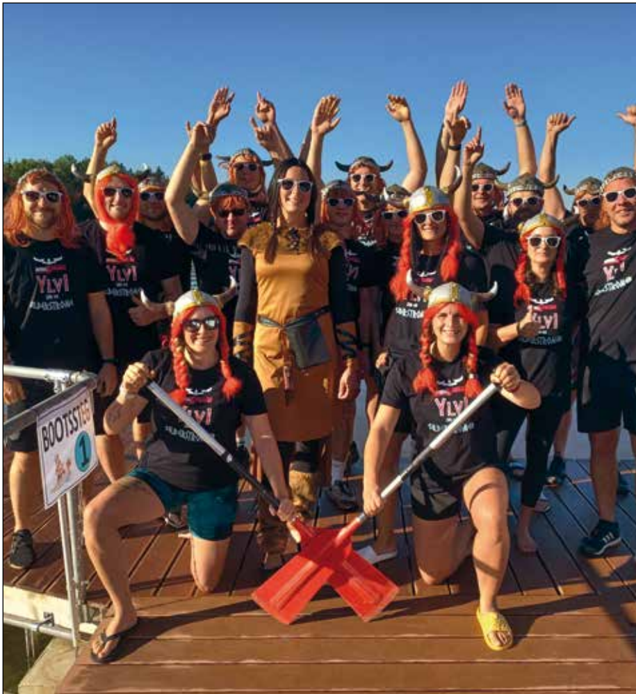
Hier sind die Platzierungen: